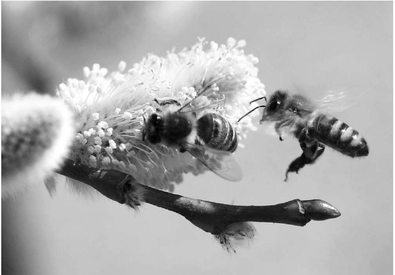
Frühlingserwachen, Foto: Franz Braunsberger

Mitteilungsblatt des Absolventenverbandes der Landwirtschaftsschule Schlierbach