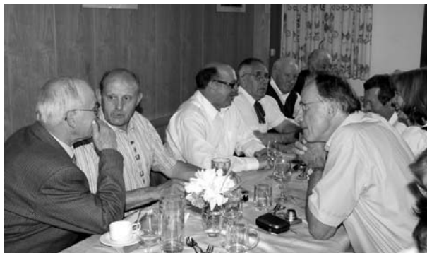
Der Absolvententag - eine ideale Gelegenheit, seine Schulkollegen zu treffen

Persönlich eingeladen werden heuer wieder alle runden Jahrgänge, beginnend bei den „Goldenen“ Jhg 1959, 1964, 69, 74 ...und die „Alten Herren“ Jhg 1950 und älter, soweit die Adressen verfügbar sind.