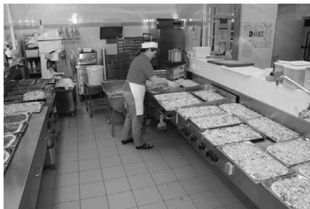
Für 160 Mittagessen wird z.B. das Pizzablech in Quadratmetern bemessen.

Die Landwirtschaftsschule ist nicht nur für die fundierte und vielseitige Ausbildung ihrer Schüler/innen bekannt, sondern auch für die ausgesprochen gute und schmackhafte Verpflegung durch das Team der Schulküche unter der Leitung von Anita Dutzler.