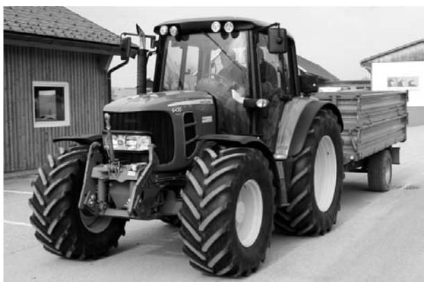
Berichte und Fotos: Hans Miglbauer

Ziel dabei ist, Einsparmöglichkeiten durch die Betriebsorganisation, die Auswahl des Traktors, Bedienung des Traktors - differenziert nach Ackerbau und Grünland - kennen zu lernen.