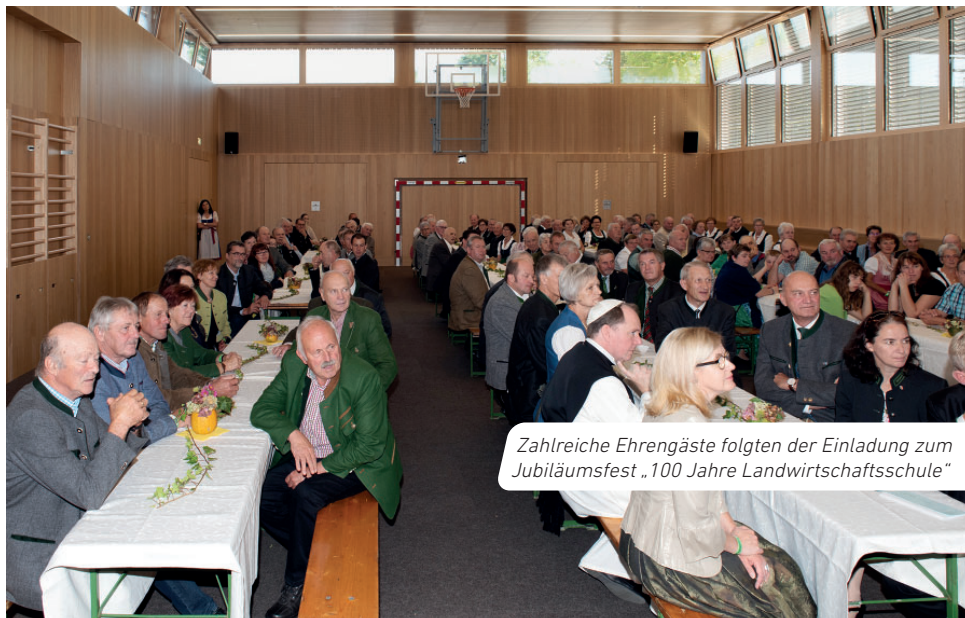
Zahlreiche Ehrengäste folgten der Einladung zum Jubiläumsfest „100 Jahre Landwirtschaftsschule“