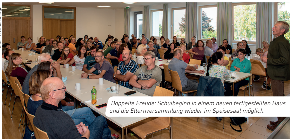
Doppelte Freude: Schulbeginn in einem neuen fertiggestellten Haus und die Elternversammlung wieder im Speisesaal möglich.