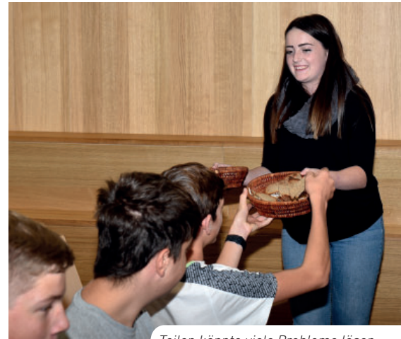
Teilen könnte viele Probleme lösen

welt und ertragreiche Wachstumsbedingungen gegeben sind, so wie sie wir in unserer Heimat vorfinden. Ein weiterer Punkt, der im Gottesdienst im Vordergrund stand, war das Teilen. Wenn man einen Teil des Geldes, das in den Industriestaaten in Projekte, die der Wohlstandserhaltung dienen, in die Hilfe hungerleidender Menschen investieren würden, wäre das wohl die Lösung für das Welthungerproblem für sehr lange Zeit. Es wollen aber anscheinend zu wenige etwas daran ändern.