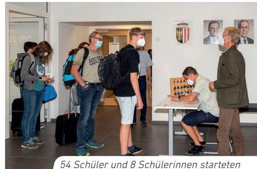
54 Schüler und 8 Schülerinnen starteten am 13. Sept. ihre Ausbildung in Schlierbach

Das Interesse, den landwirtschaftlichen Facharbeiter im zweiten Bildungsweg zu erwerben, ist besonders groß, sodass wir heuer erstmals 2