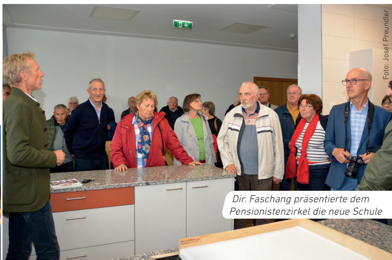
Dir. Faschang präsentierte dem Pensionistenzirkel die neue Schule