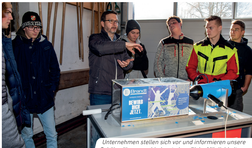
Unternehmen stellen sich vor und informieren unsere Schüler über verschiedenste berufliche Möglichkeiten