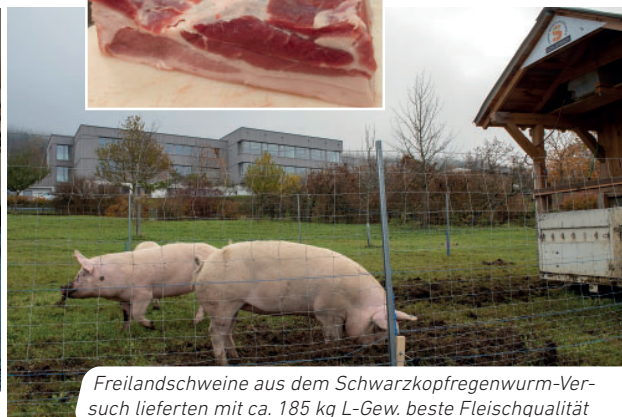
Freiland-schweine aus dem Schwarzkopfrengewurm-Versuch lieferten mit ca. 185 kg L-Gew. beste Fleischqualität