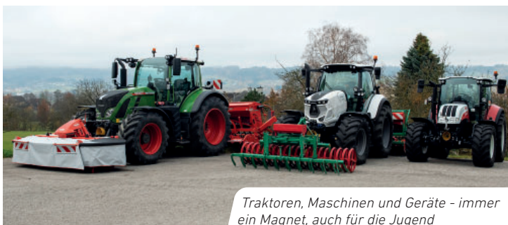
Traktoren, Maschinen und Geräte - immer ein Magnet, auch für die Jugend

Im Freigelände gab es eine Tierschau (unter anderem auch die Freiland-schweine aus dem Schwarzkopfrengewurm-Versuch von Bernhard Reitner) und Vorführungen aus dem Bereich der forstwirtschaftlichen Ausbildung.