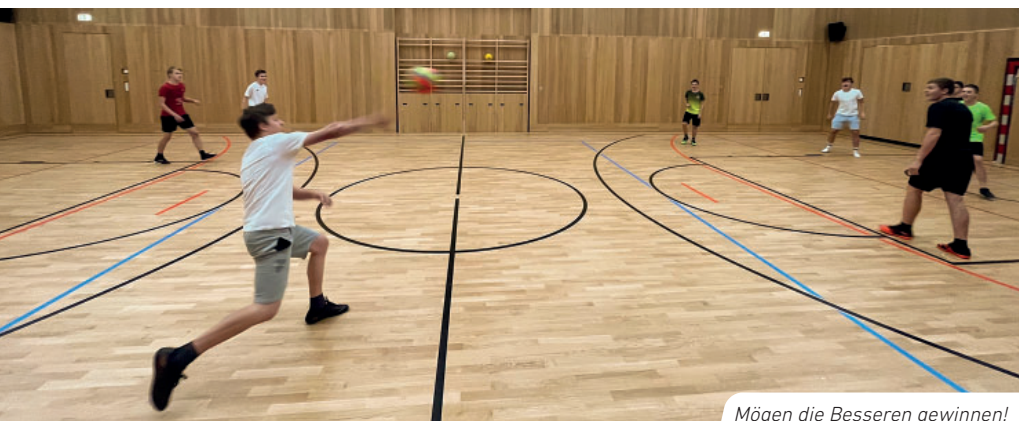
Mögen die Besseren gewinnen!