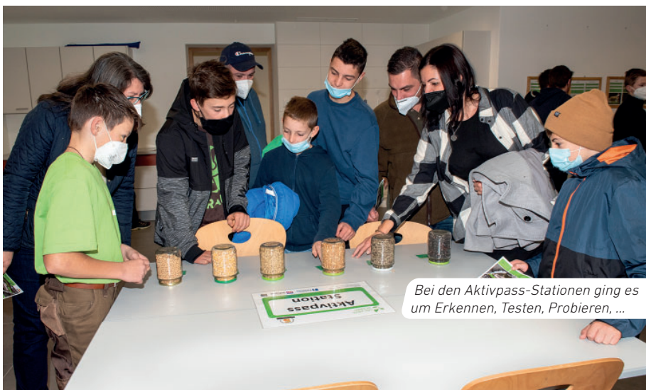
Bei den Aktivpass-Stationen ging es um Erkennen, Testen, Probieren, ...