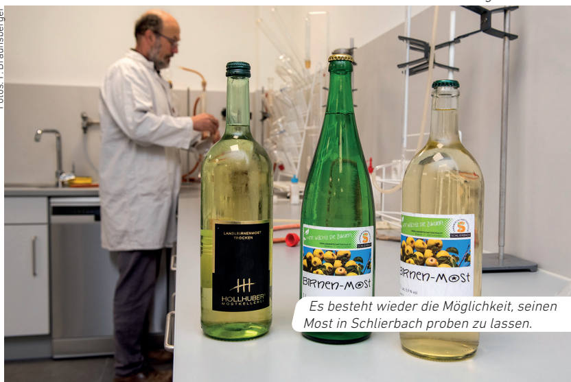
Es besteht wieder die Möglichkeit, seinen Most in Schlierbach proben zu lassen.