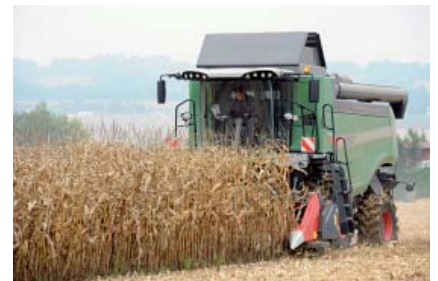
Viele interessierten sich für die Ernte des Maisversuches bei Fam. Mörtenhuber