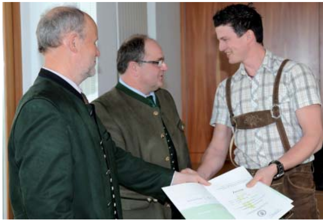
Überreichung des Meisterzeugnisses als Höhepunkt der landw. Fachausbildung

Die Ausbildung zum Landwirtschaftsmeister ist der krönende Abschluss der landwirtschaftlichen Fachausbildung. Besonderer Wert wird in der Meisterausbildung auf die Berücksichtigung betriebsspezifischer Schwerpunkte gelegt. Die Ausbildung im Bereich der Unternehmensführung ist zentraler Punkt der Meisterausbildung. Themenbereiche wie Aufzeichnungen, Buchhaltung sowie Investitions- und Finanzierungsrechnung werden gerade unter dem Aspekt der beschlossenen Änderungen in der Einheitsbewertung und in der Pauschalierungsverordnung immer wichtiger. Diesen Anforderungen wird auch in der Meisterausbildung verstärkt Rechnung getragen. So wird in Zukunft nicht nur ein Buchführungsjahr gefordert, sondern zwei Buchführungsjahre. Das gibt eine bessere Grundlage für die Hausarbeit und noch fundiertere Kennzahlen vom eigenen Betrieb. Der Ablaufplan (unten) gibt einen klaren Überblick über den zeitlichen Ablauf der künftigen Meisterkurse.