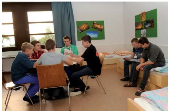
Neue Böden, Türen, Möbel und frische Farben bei den Pinwänden verleihen den 5-Bettzimmern wieder angenehme Wohnlichkeit

Meine größte Leidenschaft aber ist der Tennissport, welchen ich seit meinem fünften Lebensjahr betreibe. Vor einigen Jahren absolvierte ich die Ausbildung zum staatlich geprüften Tennislehrwart und in diesem Jahr schloss ich die Tennislehrerausbildung erfolgreich ab. Ich spiele aktiv in der Mannschaft des TC Gmunden (Oberösterreichliga). Mein Lebensmotto: „Geht nicht - gibt's nicht! Alles ist möglich!“