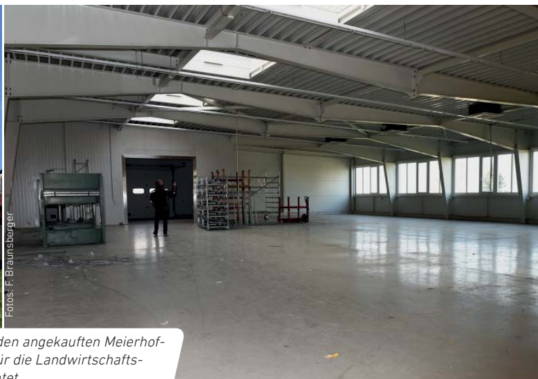
Auf ca. 2000 m 2 werden in den angekauften Meierhofgebäuden die Werkstätten für die Landwirtschaftsschule Schlierbach eingerichtet.