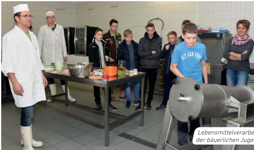
Lebensmittelverarbeitung steht auch bei der bäuerlichen Jugend hoch im Kurs.