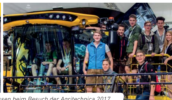
Die 3. Klassen beim Besuch der Agritechnica 2017