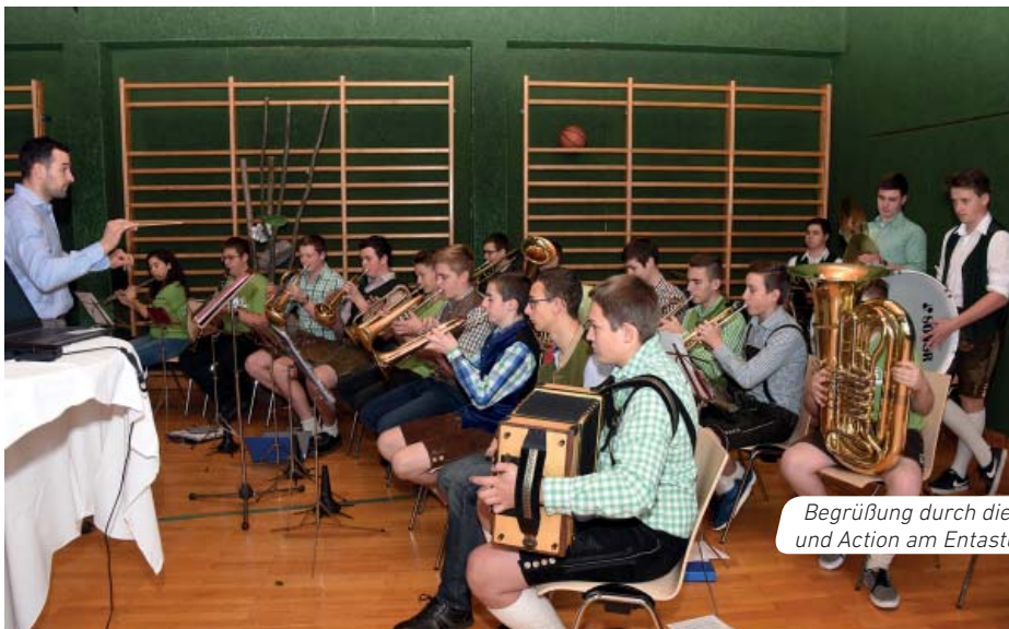
Begrüßung durch die Schülerblasmusik und Action am Entastungssimulator