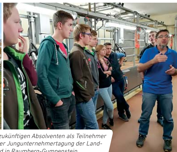
Die zukünftigen Absolventen als Teilnehmer bei der Jungunternehmertagung der Landjugend in Raumberg-Gumpenstein