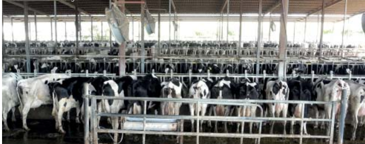
Ein landwirtschaftliches Highlight bei der Abschlussreise: Betrieb mit 1.200 Rindern