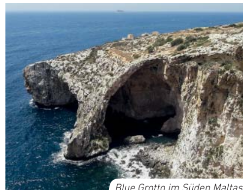
Blue Grotto im Süden Maltas

Malta ist eine kleine Insel(gruppe) ohne Fluss und ohne See mit einer Ausdehnung von ca. 28 x 13 km und einer Fläche von 316 km 2 (zum Vergl.: