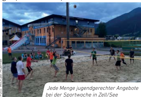
Jede Menge jugendgerechter Angebote bei der Sportwoche in Zell/See

Vom 25. - 29.06.2018 fuhren 1 Schülerin, 46 Schüler sowie 3 Lehrer ins wunderschöne Salzburger Land. Das sportliche Programm konnten die Schüler aus Tennis spielen, Kajak fahren, Surfen, Klettern oder Mountainbiken nach eigenen Interessen zusammenstellen. Zudem gab es ein umfangreiches Freizeitangebot (Fußball, Beach Volleyball, Trampolin, Kegeln, Boulder Halle).