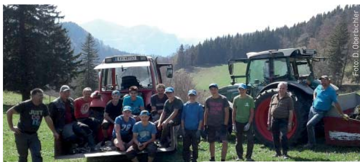
Weidepraxis auf der Brettmaisalm