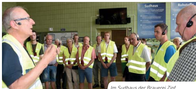
Im Sudhaus der Brauerei Zipf

Unser besonderes Mitgefühl gilt den Angehörigen der Verstorbenen.