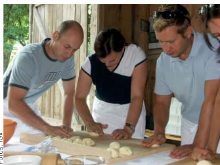
Brotback-Workshop: Während der Teig geht, ein Blick auf das Feld, um die kommende Ernte zu beurteilen und mehr über das Getreide zu erfahren