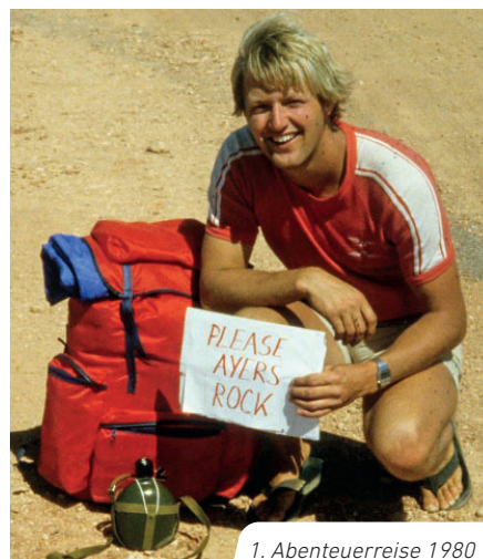
1. Abenteuerreise 1980

Gefängnis. Im Iran wurde er als Spion verdächtigt und landete ebenfalls hinter Gittern. Enorm gefährlich war auch seine Reise durch Afghanistan, von der er verbotene Bilder mit den Taliban mitbrachte. Diese erhielten nach den 9/11-Terroranschlägen eine ganz besondere Bedeutung.