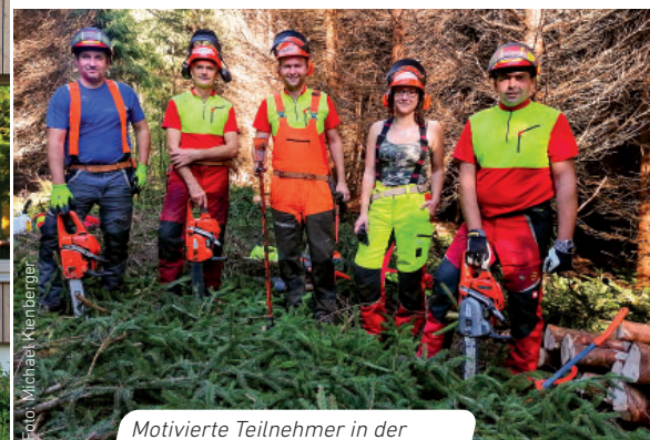
Motivierte Teilnehmer in der Abendschule für Forstwirtschaft