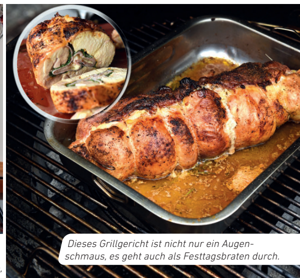
Dieses Grillgericht ist nicht nur ein Augenschmaus, es geht auch als Festtagsbraten durch.