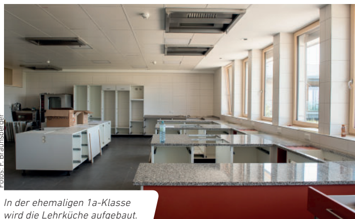
In der ehemaligen 1a-Klasse wird die Lehrküche aufgebaut.